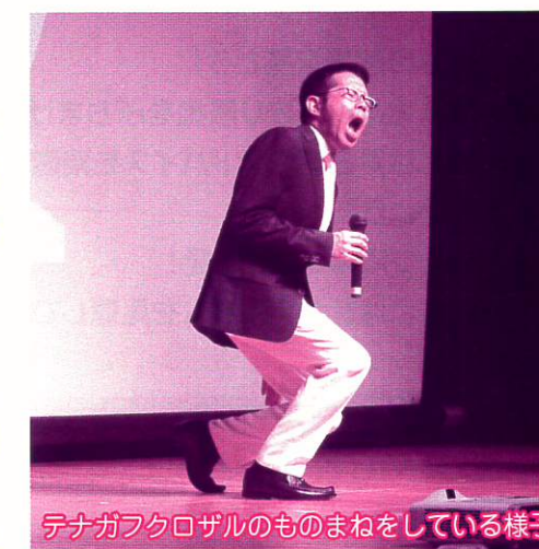
テナガフクロザルのものまねをしている様子

講演では、18歳から12年間もの闘病生活で学んだことを中心に、江戸家の成り立ちや小猫としてデビューするまでの経緯などをお話くださいました。