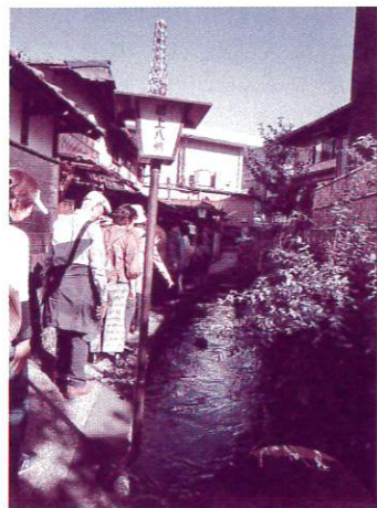
郡上八幡 「いがわ小径」

ユートピアくびき振興財団公認、名物ガイドさんの軽妙なトークから研修旅行は始まりました。一番行きたかった郡上八幡では、「天空の城」として名高い郡上八幡城を見上げながら城下町を散策。清水橋、サンプル工房、いがわ小路の水路には、鯉やアマゴなどが泳いでいて、人と共存している素敵な場所でした。また、郡上踊りの実演を見せて頂き踊りも教えて頂きました。桧の一枚物の下駄をタップダンスの様に鳴らして踊るこの踊りは、なんと31日間続けられるそうです。