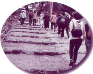
犬山城までは急な坂道