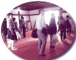
犬山城天守閣の赤絨毯