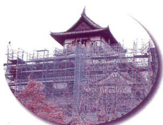
天守閣工事中の犬山城