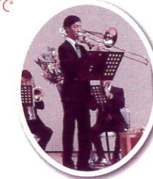
バストロンボーンの「おぼろ月夜」は重厚な低音が魅力