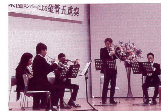
トランペット(2本)、ホルン、トロンボーン、バストロンボーンによる五重奏

去る11月18日に希望館で、新日本フィルハーモニー交響楽団メンバーによる金管五重奏の演奏会を開催しました。金管楽器による演奏会は初めての試みでしたが、勇壮で煌びやかな音色と五重奏のハーモニーに魅了されました。クラシックや映画音楽、演歌やジブリ音楽と多彩なプログラムと工夫の凝らした演出で大変盛り上がり、曲の解説や各楽器の紹介は、ユーモアを交え大変分かり易くお話いただき、会場は終始楽しい雰囲気に包まれました。今回も会場が満席になるほどの大勢の方にご鑑賞いただきました。