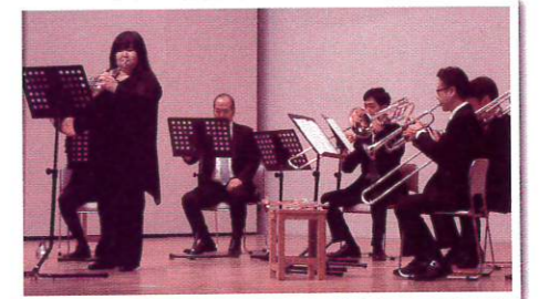
「ホルンコンチェルト第3番」はサンバ風アレンジで大サンバ!!