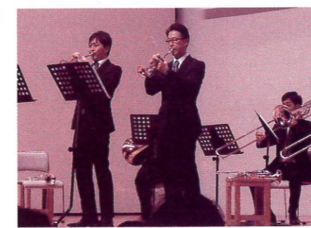
「2本のトランペットのためのアリア」で幕開けトランペットの清々しく凛々しい音色が響き渡りました