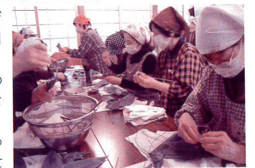
真剣な表情でちまきを巻く参加者

参加者からは「詳しく教えてもらうことができてよかった」「とても楽しかった。また参加したい」との感想が寄せられました。