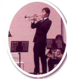
「アメージンググレース」はジャズ風アレンジでかっこよく!